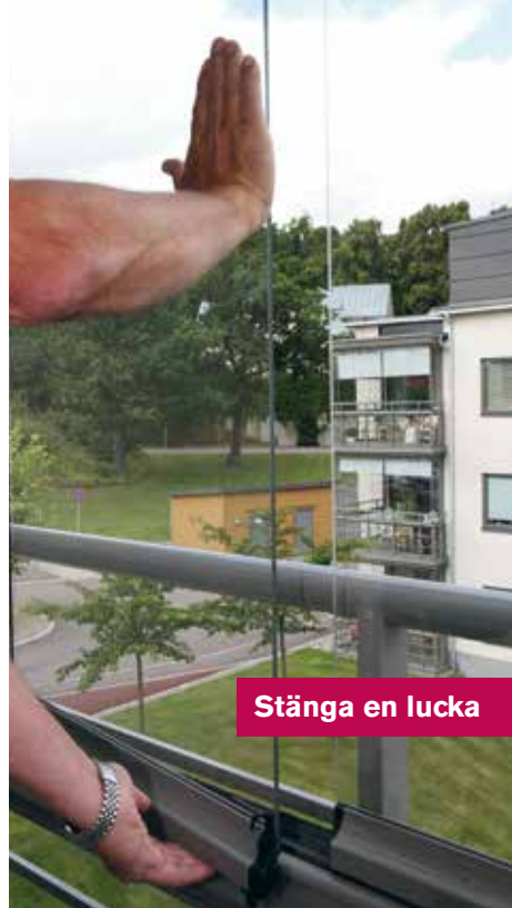
Stänga en lucka